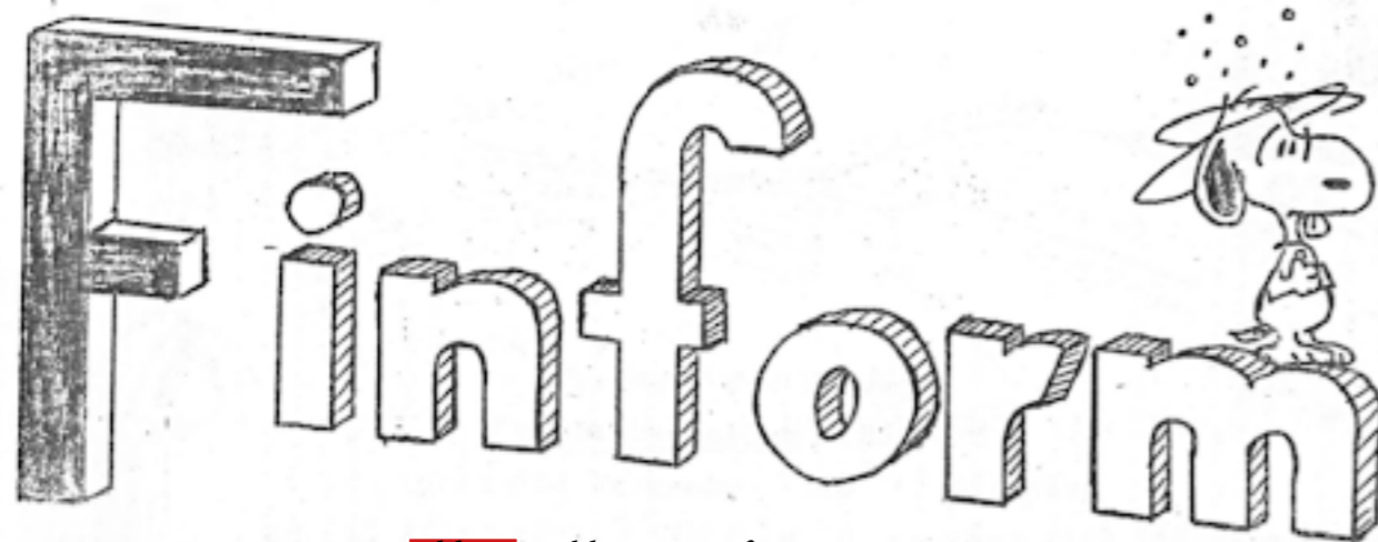
Bildtext: Urklipp ur Finform nr 4 1968

Nej, ni läste inte fel! Snobben användes kontinuerligt som maskot för Finform i alla utgåvor jag kunde hitta från och med det allra första numret från februari 1968. Tyvärr börjar Snobben-bilderna sina framåt mitten av 70-talet och av en konstig händelse är det runt den tiden som diskussioner om sektionshelgon på V-sektionen först togs upp. Nu tog detta projekt, likt ett brobygge eller västlänken, nästan ett årtionde att slutföra när V:arna 1982 till slut valde in Snobben som helgon. Sedan dess har inte mycket skett för att hämnas denna skymf, men Finform minns.