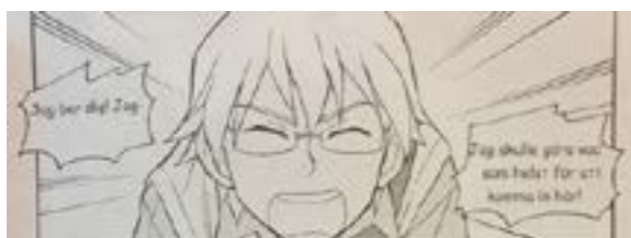
Bild från mangan eller en bild på nollan

Karateklubbens ordförande, Ichinose Sentarou, är till en början tveksam till att ta in en så svag och tanig pojk som Reiji, men går till slut med på att låta honom vara med på ett villkor: Reiji måste lära ut linjär algebra till Sentarous lillasyster Misa. Reiji tackar ja till erbjudandet direkt, och efter detta får vi följa hans äventyr när försöker förklara linjär algebra för Misa.