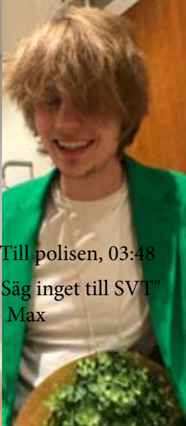
Till polisen, 03:48 "Säg inget till SVT" - Max