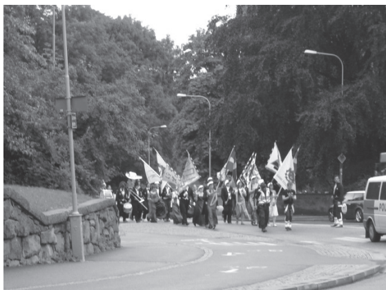
Fanborgen som visar att Nollan är på väg

På onsdagen var det lektioner och rundvandring i regn och sol och