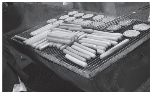
NollK grillar korv i stora högar

Under skattjakten var alla deltagare duktiga på att känna igen citat men till Anders besvikelse hade ingen läst Slaget vid Meldun om hur vikingarna tilläts vada över floden Panta. Två grupper klarade elva av tolv citat. Samtliga grupper blevo blöta.