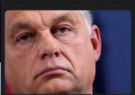
Uppgift: Orbans pengar stoppas

Utredning av sexuella trakasserier inom utbildningsverksamheten/ Studenter på juristprogrammet