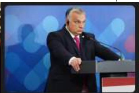
Ungern ska godkänna svensk Natoansökan