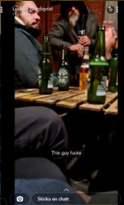
This guy fucks