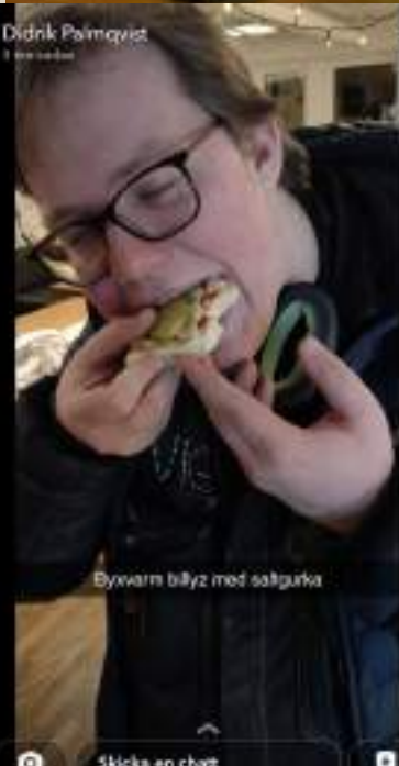
Byvamn billyz med saltgurka