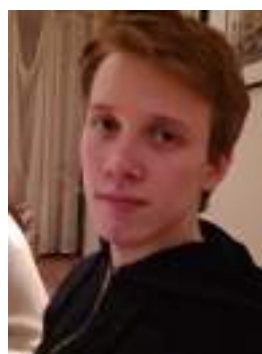
Obs! Inte faktiskt (vad jag vet) en bodyguard.

Whether by instinct or my notepad they somehow identified me as the journalist I am, and would speak no word to me. I did, however, manage to snap a picture of Divanovoitch but was immediately approached by a less than amused bodyguard, (see picture below), who rather violently threw me out. I'm lucky to be alive frankly. It's dangerous work being a journalist investigating the rich and powerful, but hopefully you, dear reader, have at least gleaned a bit of insight into the world of Russian billionaires we live in. Stay vigilant!